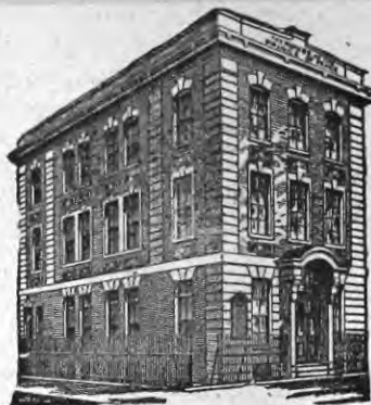
בית שר שלום

ער האָט אויך געהאַט די זכיה צו זעהן מעהרערע אידען ארויס קומען מאפילה לאור גדול בישוע המשיח דורך זיינע דרשות און דורך זיינע טהאטען. יא אפילו זיין אייגענע שוועסטער וואָס האָט אס אנפאנג זעהר קרום געקוקט אויף איהם צוליעב זיין גלויבען אין משיח, יא אויך זי האָט דעם "קשה עורף" געבויען און אָנגעהויבען אין איהם צו גלויבען. ער האָט אסאך צובראכענע געדי מיטהער אויפגעריכט און אסאך דערשלאגענע הער-צער מחיה געווען. און "כל המחיה נפש אחת מישראל כאולו קיים עולם מלא". מי יתן והיה רבים בישראל כמוהו.