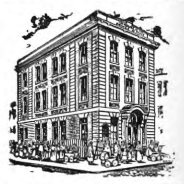
HEADQUARTERS BETH SAR SHALOM Throop Avenue and Walton Street Brooklyn, N. Y.

Original work established by Leopold Cohn in 1894