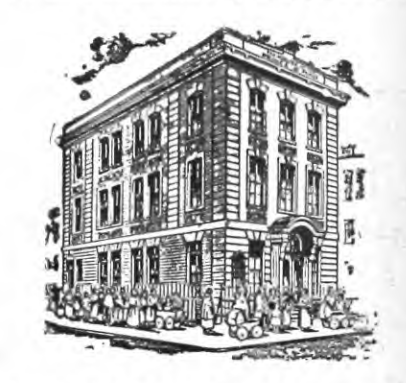
HEADQUARTERS BETH SAR SHALOM Throop Avenue and Walton Street Brooklyn, N. Y.

Original work established by Leopold Cohn in 1894