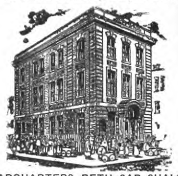
HEADQUARTERS BETH SAR SHALOM Throop Avenue and Walton Street Brooklyn, N. Y.

Original work established by Leopold Cohn in 1894